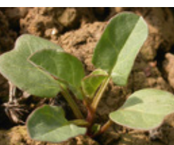
Poponac - Convolvulus a.