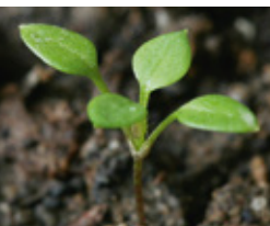
Mišljankinja - Stelaria m.