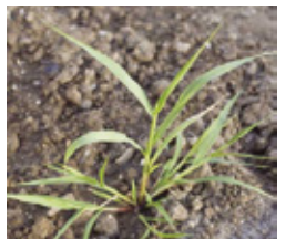
Muhar - Setaria spp.