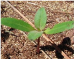
Čičak - Xanthium s.