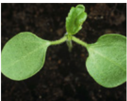
Njiv. lubeničarka - Hibiscus t.