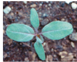
Štir - Amaranthus r.