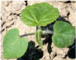
Abutilon - Abutilon t.