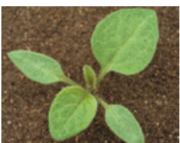
Pomoćnica - Solanum n.