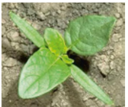
Tatula - Datura s.