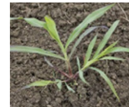
Sirak - Sorghum h.

Za sva pitanja pozovite Vašeg savetodavca iz Agroservisa Sunoko: