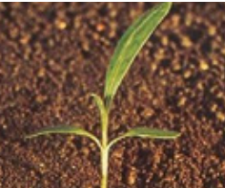
Dvornik - Polygonum spp.