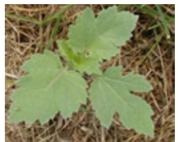
Iva - Iva x.