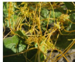
Vilina kosica - Cuscuta spp.