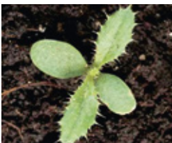
Palamida - Cirsium a.