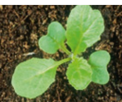
Poljska gorušica - Sinapis a.