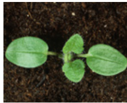
Prst.čestoslavica - Veronica h.