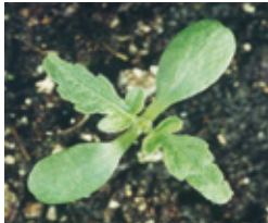
Ambrozija - Ambrosia a.