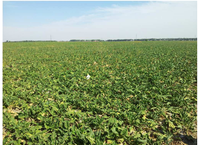
Simtomi na njivi