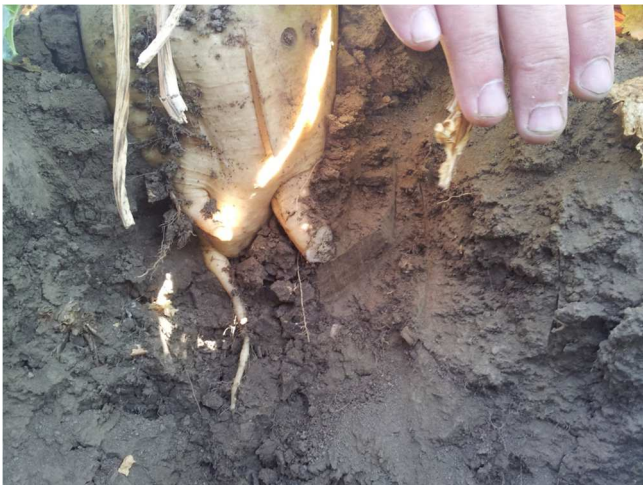
Račvanje korena kao posledica sabijenog zemljišta

Postoje mere kojima se može uticati na poboljšanje strukture zemljišta i smanjenje sabijanja zemljišta, a koje će biti objašnjene u tekstu koji sledi. Njihovo korišćenje je veoma bitno, jer je upravo NEBRIGA O OSNOVNOM RESURSU POLJOPRIVREDNE PROIZVODNJE I OSNOVNOM IZVORU PRIHODA U VOJVODINI – ZEMLJIŠTU uzrok mnogobrojnih problema u proizvodnji, pojave različitih bolesti i nemogućnosti dostizanja prinosa koji ostvaruju evropski proizvođači. Pre nego potražimo bilo koji drugi razlog, potražimo ga najpre u aktivnostima koje smo sami uradili, tj. analizirajmo uvek svaku meru koju smo sproveli.